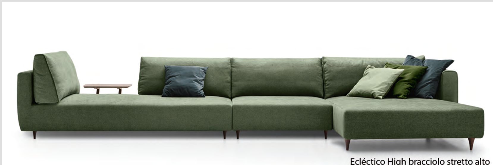
Eclético High bracciolo stretto alto