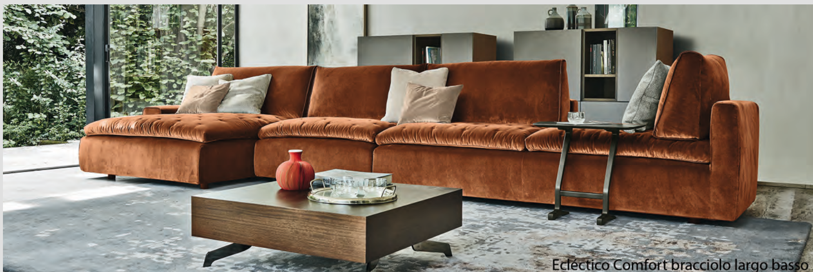
Eclético Comfort bracciolo largo basso